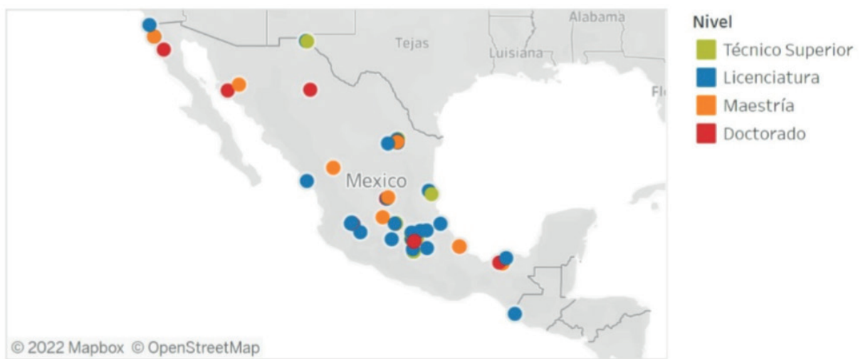
Figura 8. Programas educativos de nanotecnología en México